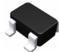
BU4823F-TR LAPIS Semiconductor IC VOLT DETECTOR 2.3V SOP4