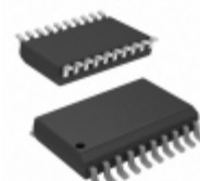
PIC16F527-E/SO Microchip Technology IC MCU 8BIT 1.5KB FLASH 20SOIC