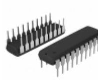
PIC16F527-I/P Microchip Technology IC MCU 8BIT 1.5KB FLASH 20DIP