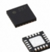
PIC16F527-I/JP Microchip Technology IC MCU 8BIT 1.5KB FLASH 20UQFN