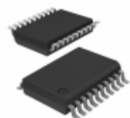
PIC16LF84A-04I/SS Microchip Technology IC MCU 8BIT 1.75KB FLASH 20SSOP