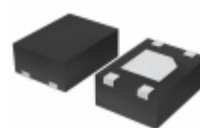
BU34TA2WNVX-TR Rohm Semiconductor IC REG LDO 3.4V 0.2A 4SSON