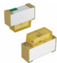
SML-A12D8TT86 Rohm Semiconductor LED ORANGE CLEAR 2SMD R/A