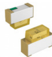
SML-A12DTT86 Rohm Semiconductor LED ORANGE CLEAR 2SMD R/A