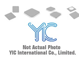
SML-A12MTT86 R ROHM SML-A12MTT86 R ROHM