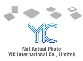
SML-A12DTT86 T ROHM SML-A12DTT86 T ROHM