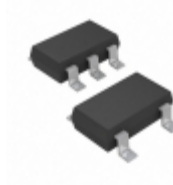
MIC5317-3.0YD5-TR Microchip Technology IC REG LDO 3V 0.15A TSOT23-5