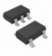
MIC5317-3.0YD5-T5 Microchip Technology IC REG LDO 3V 0.15A TSOT23-5