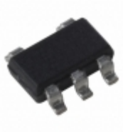
MIC5317-3.0YM5-TR Microchip Technology IC REG LDO 3.0V 0.15MA 5SOT23