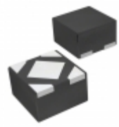
MIC5317-3.0YMT-T5 Microchip Technology IC REG LDO 3V 0.15A 4TDFN