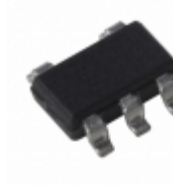
MIC5317-3.0YM5-T5 Microchip Technology IC REG LDO 3V 0.15A SOT23-5