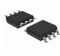
93LC46T-I/SN Microchip Technology IC EEPROM 1KBIT 2MHZ 8SOIC