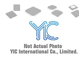
MPQ4558DQ-LF-P Monolithic Power Systems Inc. IC REG BUCK ADJ 1A