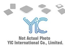
MPQ4488GU-AEC1-Z MPS (Monolithic Power Systems) 36V, 6A, BUCK CONVERTER WITH DUA