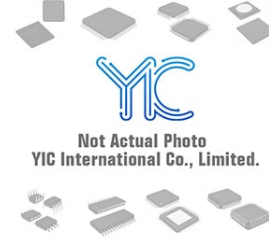
SC77699D MOT MOT SOIC-14