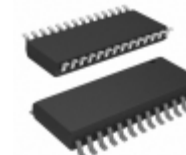
PIC24FJ256GA702T-I/SO Microchip Technology IC MCU 16-BIT 256KB FLASH 28SOIC