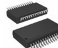
PIC24FJ256GA702T-I/SS Microchip Technology IC MCU 16-BIT 256KB FLASH 28SSOP