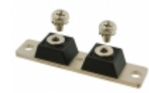
MBR500150CTR GeneSiC Semiconductor DIODE SCHOTTKY 150V 250A 2 TOWER