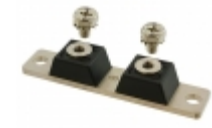
MBR500200CTR GeneSiC Semiconductor DIODE SCHOTTKY 200V 250A 2 TOWER