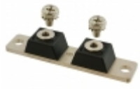
MBR500200CT GeneSiC Semiconductor DIODE SCHOTTKY 200V 250A 2 TOWER