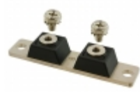
MBR50020CT GeneSiC Semiconductor DIODE MODULE 20V 500A 2TOWER