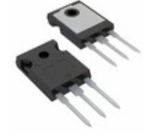
IRG4PC40UPBF Infineon Technologies IGBT 600V 40A 160W TO247AC