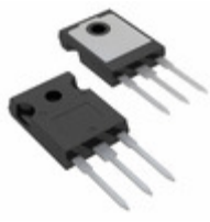
IRG4PC50FDPBF Infineon Technologies IGBT 600V 70A 200W TO247AC