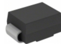
CZRB5345B-HF Comchip Technology ZENER 5W 8.7V SMB/DO-214AA ROHS