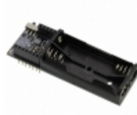
RFD22126 RF Digital RFDUINO DUAL AAA SHIELD