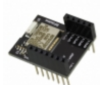
RFD22102 RF Digital Corporation RF TXRX MOD BLUETOOTH CHIP ANT