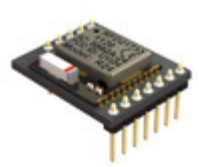
RFD21813 RF Digital Corporation RF TXRX MODULE ISM>1GHZ CHIP ANT