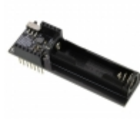
RFD22127 RF Digital RFDUINO SINGLE AAA SHIELD