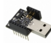
RFD22121 RF Digital RFDUINO USB SHIELD