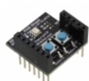
RFD22122 RF Digital RFDUINO RGB SHIELD