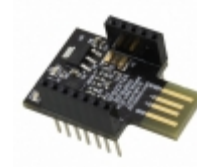
RFD22124 RF Digital RFDUINO PCB USB SHIELD