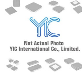
MC33182PG ON MC33182PG ON