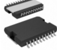
MC33186DH1 NXP USA Inc. IC MOTOR DRIVER PAR 20HSOP