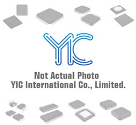
KSC2316-Y FSC KSC2316-Y FSC