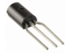
KSC23160BU Fairchild/ON Semiconductor TRANS NPN 120V 0.8A TO-92L