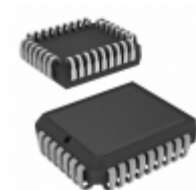
AT49F002N-55JC Microchip Technology IC FLASH 2MBIT 55NS 32PLCC