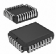
AT49F002N-12JI Microchip Technology IC FLASH 2MBIT 120NS 32PLCC