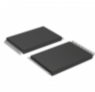
AT49F002AT-55VI Microchip Technology IC FLASH 2MBIT 55NS 32VSOP