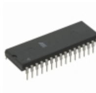
AT49F002N-12PC Microchip Technology IC FLASH 2MBIT 120NS 32DIP