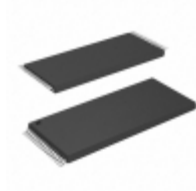
AT49F002N-12TC Microchip Technology IC FLASH 2MBIT 120NS 32TSOP