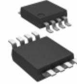
MCP4552-502E/MS Microchip Technology IC DGTL POT 5K 257TAPS 8-MSOP