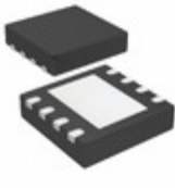
MCP4552T-502E/MF Microchip Technology IC DGTL POT 5K 257TAPS 8-DFN